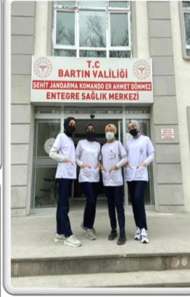
Entegre Sağlık Merkezi