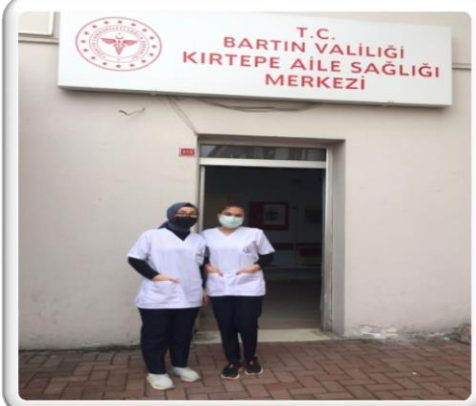
Aile Sağlığı Merkezi